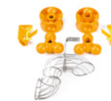
Kit de Pressage Kit S (45 - 67 mm)