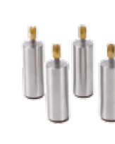
Kit de Surélévation