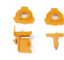
Système de Coupe Dynamique DCS